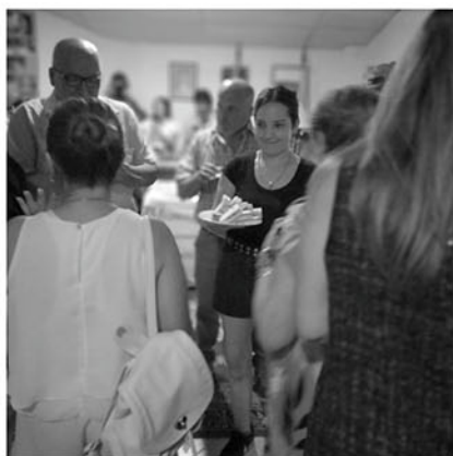
El público disfruta del cóctel.