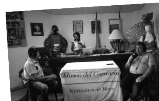
Fiebre de Carnaval siempre presente.