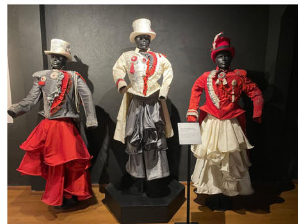
Murga Los Saltimbanquis, vestuario de salpicón y couples, carnaval 2018