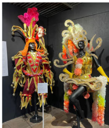
Vestuario de Emperadores de la Zona Sur; "Polichinella" y "Bailarina", carnaval de Artigas 2022