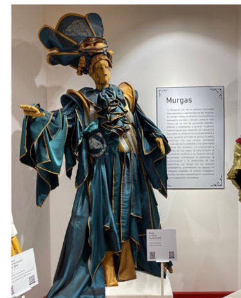
Vestuario de despedida, diseño de Ana Laura de León