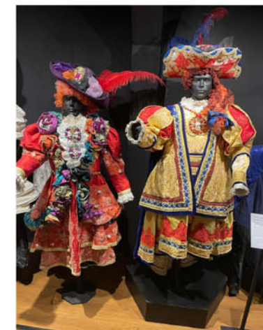
Murga Los Saltimbanquis, carnaval 2018