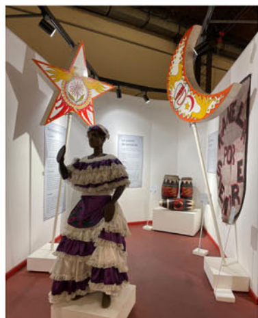
Otro aspecto del Museo