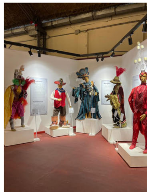
Murga La Clave, carnaval 2018