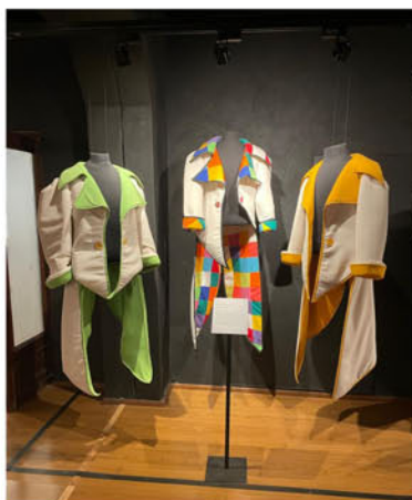
Murga Contrafarsa, carnaval 2004