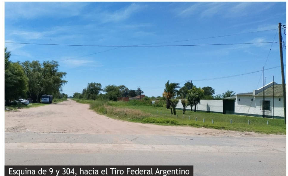
Esquina de 9 y 304, hacia el Tiro Federal Argentino