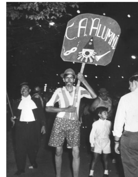
Carnaval 1969, murga del club Alumni

Los premios de la X edición serán entregados en las instalaciones del Museo del Carnaval en marzo de 2014.