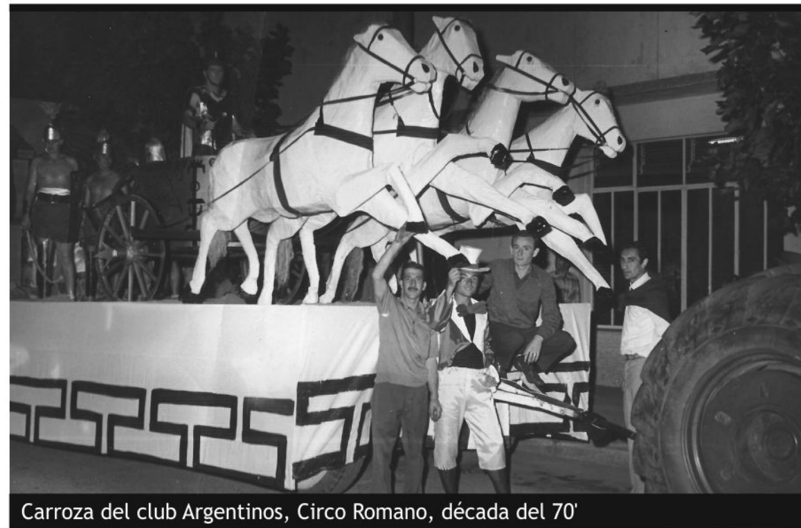
Carroza del club Argentinos, Circo Romano, década del 70'