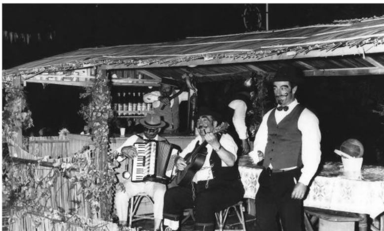
Los Tanos de la Boca, primer premio, Corso de Antaño, 1978