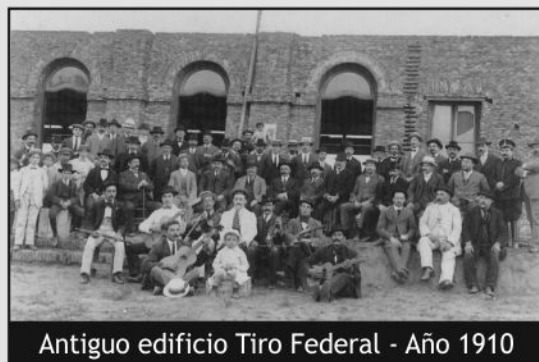
Antiguo edificio Tiro Federal - Año 1910