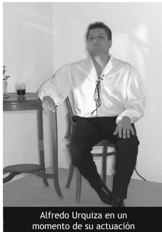
Alfredo Urquiza en un momento de su actuación

Realizó temporadas en los teatros más importantes de la Argentina (Teatro Nacional Cervantes, Teatro Municipal General San Martín, Teatro Auditorium de Mar del Plata, Coliseo Podestá de La Plata). Actuó asimismo en Perú, Cuba, Uruguay, Brasil, España, Francia, Alemania y